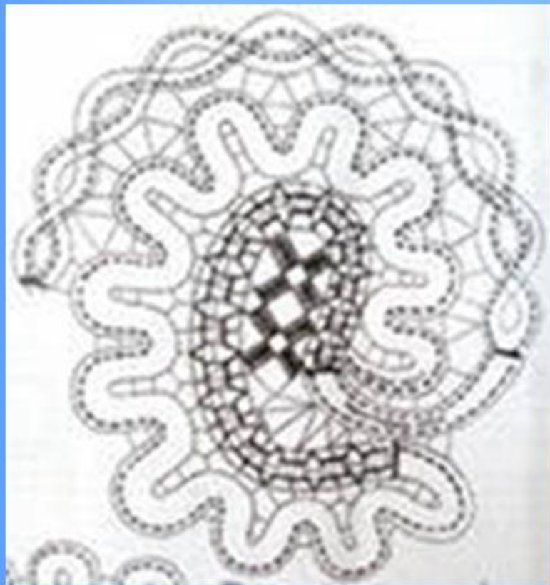
Белёвское кружево на коклюшках

Материалы для плетения употреблялись следующие: бумага разных номеров, чёрный и бело-желтоватый шёлк, нитки белые, суровые серые и суровые желтоватые, называемые мастерами «кремовые». Весь этот материал привозился в местные лавки. Например, в Белёве ниток, шёлка и бумаги в год привозилось на сумму до 4000 рублей. Кроме того, этот материал доставляли торговки кружевами из Москвы и Нижнего Новгорода.